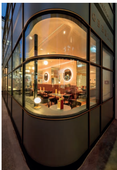
02 © BWM Architekten / SeverinWurnig