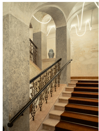
BWM_BadGastein_GrandHotelStraubinger_Stair- case_© BWM_DesignersArchitects_AnaBarros