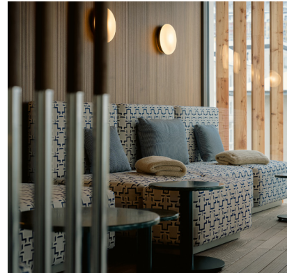
BWM_BadGastein_GrandHotelStraubinger_Spa02 © BWM_DesignersArchitects_AnaBarros