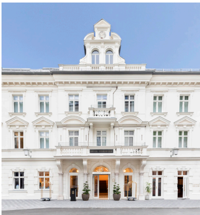
BWM_BadGastein_GrandHotelStraubinger_Aus- senansicht_© BWM_DesignersArchitects