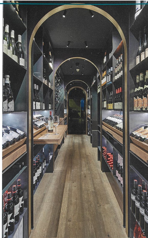
1 Warme Blautöne dominieren in den zum Karwendelgebirge ausgerichteten Gästezimmern.