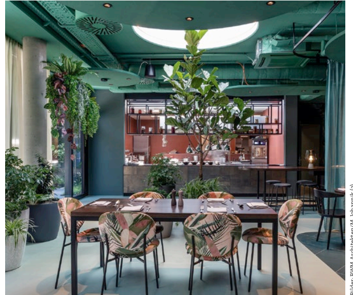
Grün ist im Restaurantbereich die bestimmende Farbe.