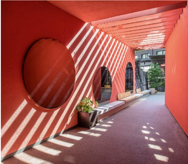
Ein Gang mit auffälliger Wandfarbe führt die Gäste zum Hideaway.