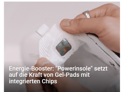
Energie-Booster: "Powerinsole" setzt auf die Kraft von Gel-Pads mit integrierten Chips