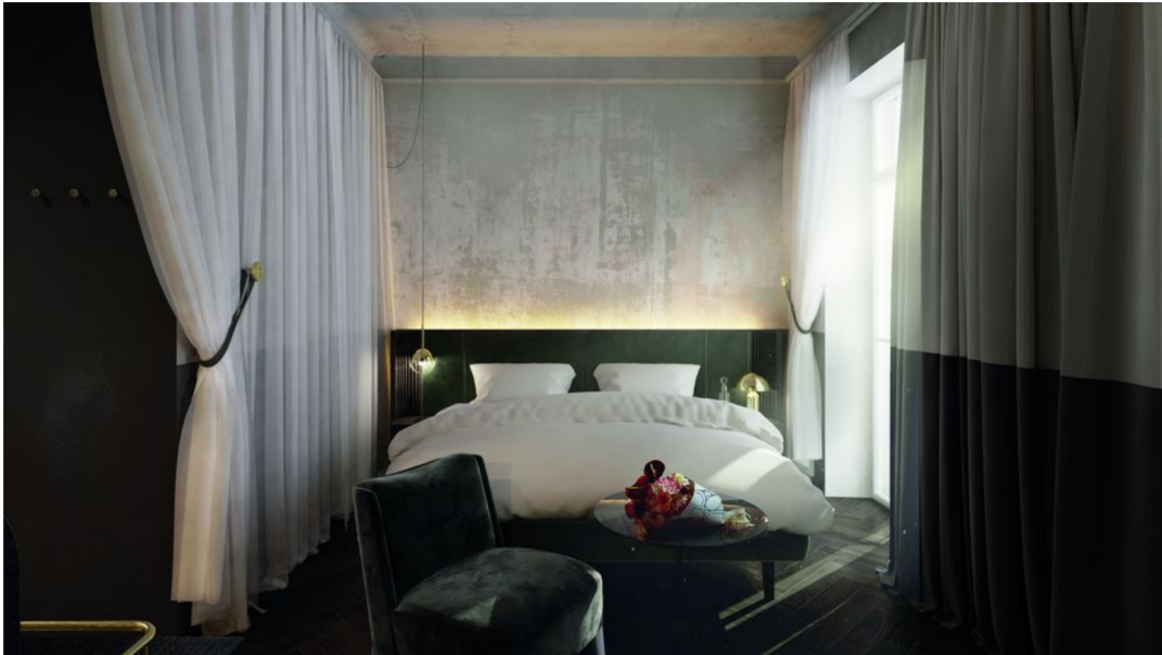
Rendering Zimmer im Straubinger © BWM Architects & Design