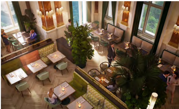
BWM_BadGastein_HotelStraubinger_Rendering_Saal1 © BWM Designers & Architects