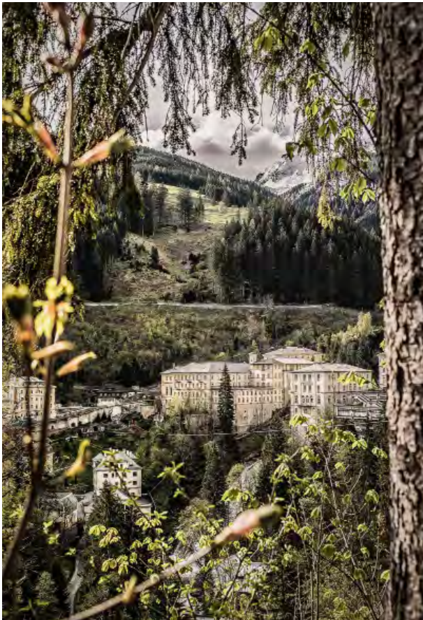
BWM Designers & Architects_BadGastein_Ansicht