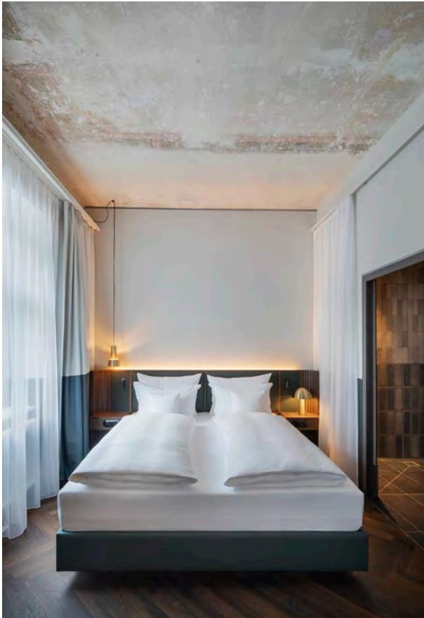
BWM_GrandHotelStraubinger_Room_ © BWM Designers & Architects