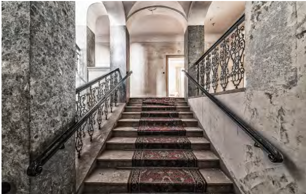
BWM Designers & Architects_BadGastein_Bestand