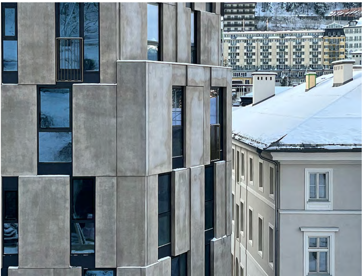
BWM_BadGastein_FassadeDetail_©BWM Designers & Architects