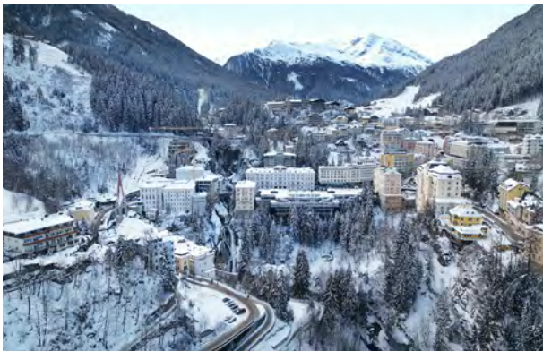
BWM_BadGastein_Drohne_01_23_©BWM Designers & Architects_EduardoGellner