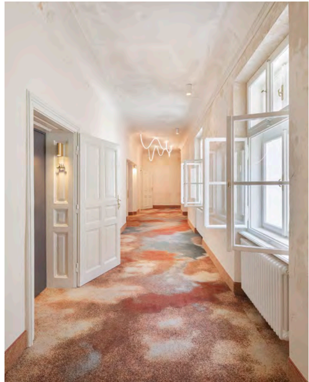
BWM_GrandHotelStraubinger_Corridor_ © BWM Designers & Architects