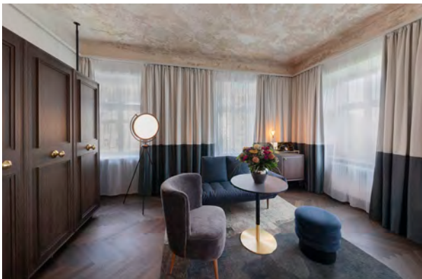
BWM_GrandHotelStraubinger_Suite01_ © BWM Designers & Architects