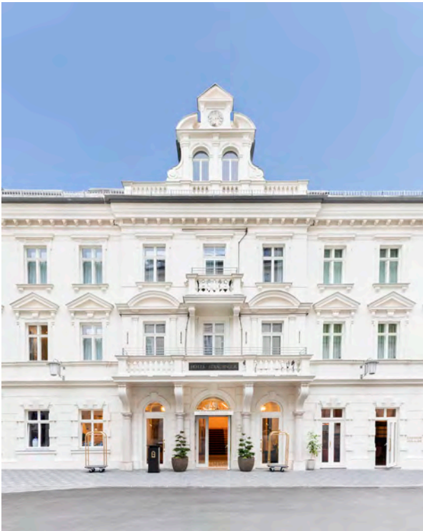
BWM_GrandHotelStraubinger_Aussenansicht01 © BWM Designers & Architects