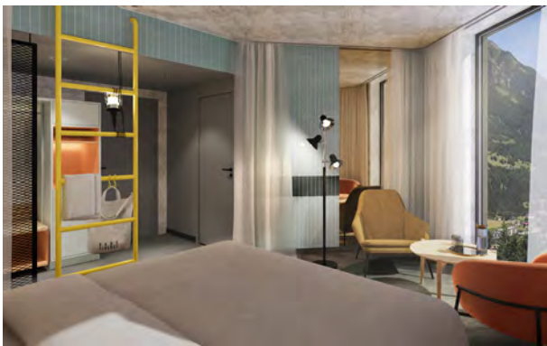
BWM_BadGastein_Badeschloss_Rendering_Room © BWM Designers & Architects