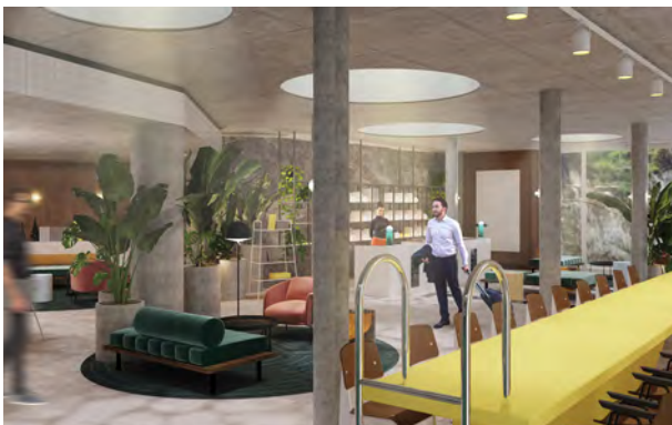
BWM_BadGastein_Badeschloss_Rendering_Lobby1_© BWM Designers & Architects