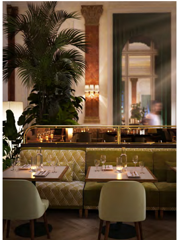
BWM_BadGastein_HotelStraubinger_Rendering_Saal2 © BWM Designers & Architects