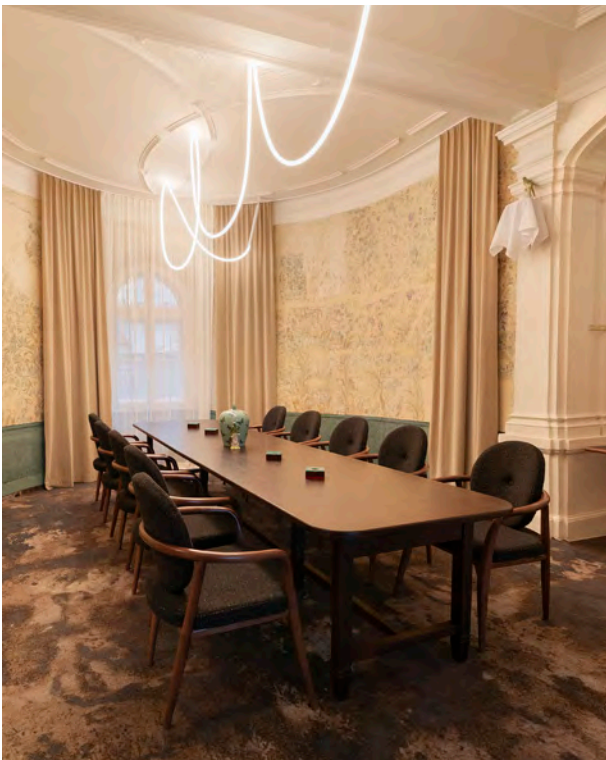
BWM_GrandHotelStraubinger_ChefsTable_ © BWM Designers & Architects