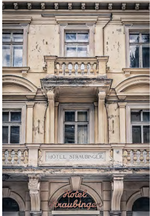
BWM Designers & Architects_BadGastein_Straubinger ©_HansSchubert