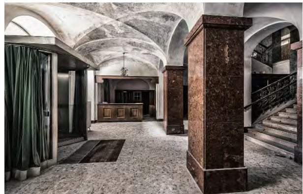
BWM Designers & Architects_BadGastein_Foyer