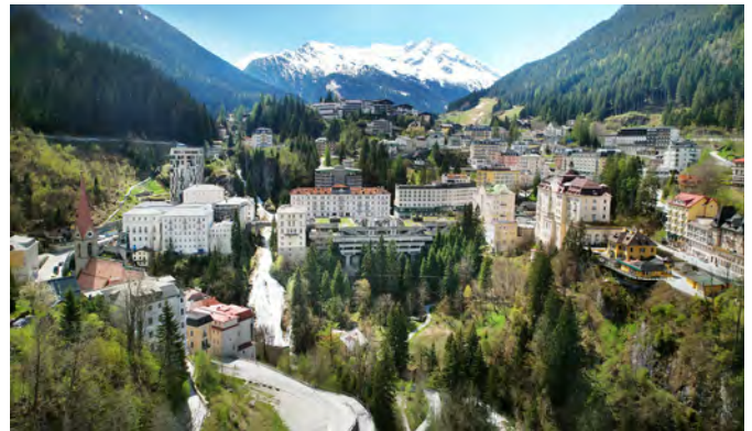
BWM_BadGastein_Drohne_05_23_©BWM Designers & Architects_EduardoGellner