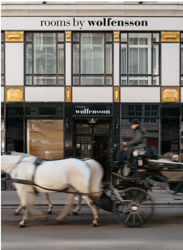
BWM rooms by wolfensson - outdoor 01 ©BWM Designers & Architects / Ana Barros

© BWM Designers & Architects | Ana Barros © Herta Hurnaus