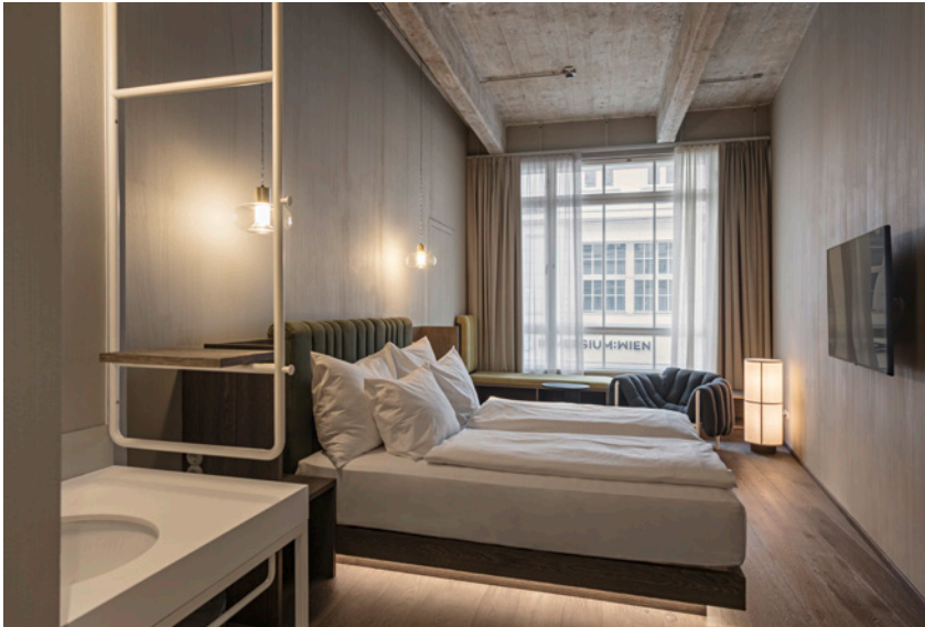
BWM rooms by wolfensson room3