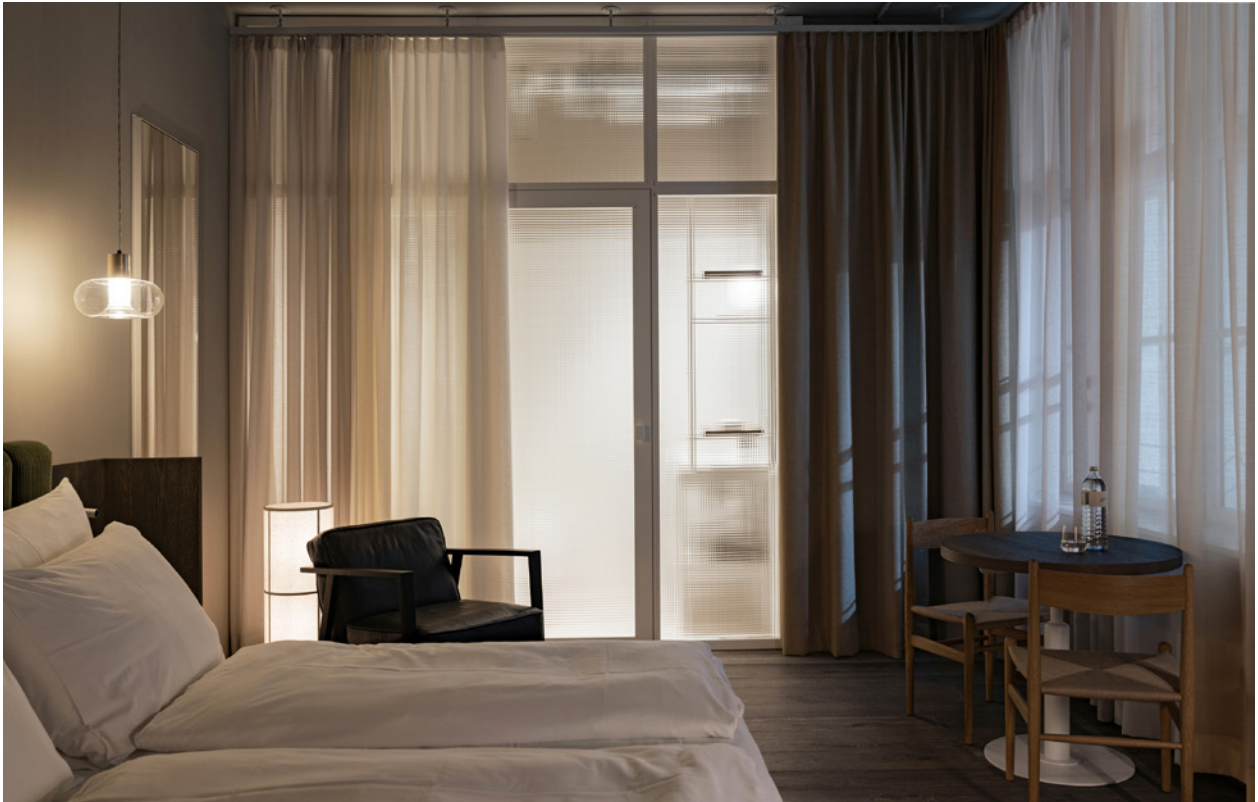
BWM rooms by wolfensson room04 ©BWM Designers & Architects / Ana Barros