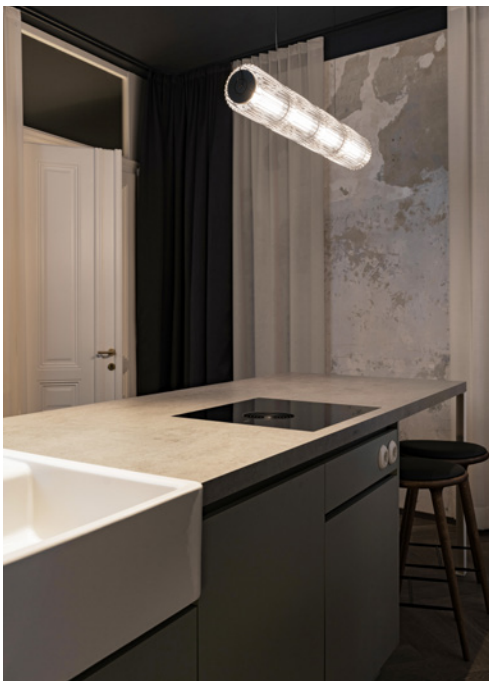
BWM rooms by wolfensson loft 01 ©BWM Designers & Architects / Ana Barros