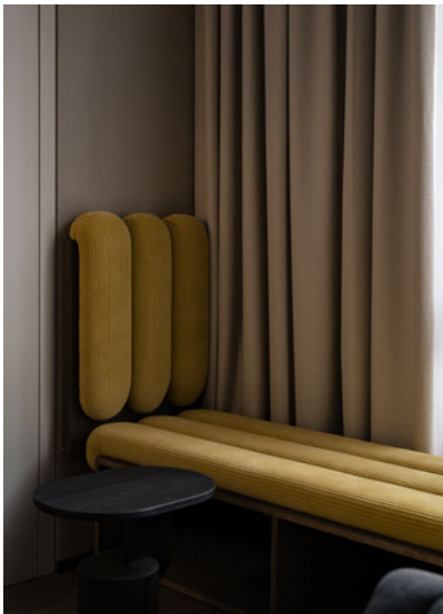
BWM rooms by wolfensson room detail 01 ©BWM Designers & Architects / Ana Barros