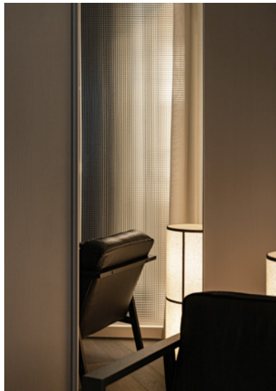
BWM rooms by wolfensson room detail02 ©BWM Designers & Architects / Ana Barros