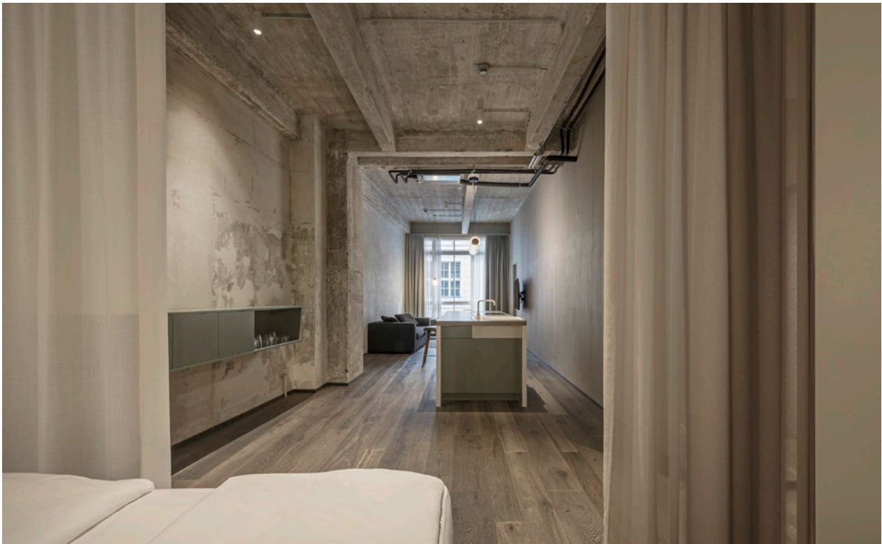
BWM rooms by wolfensson loft1_1