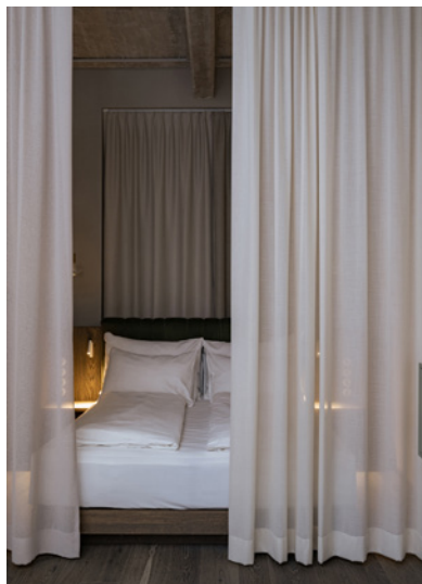
BWM rooms by wolfensson loft04 ©BWM Designers & Architects / Ana Barros