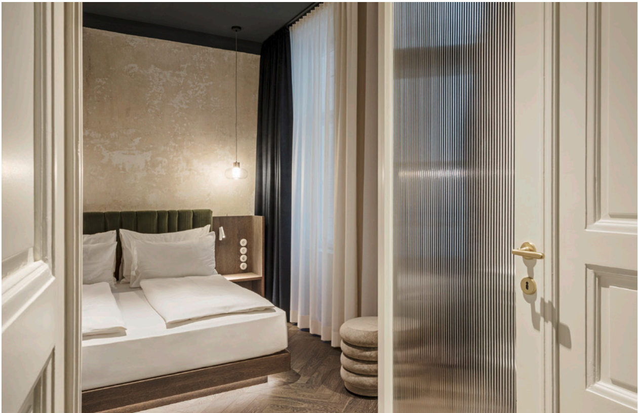
BWM rooms by wolfensson loft2