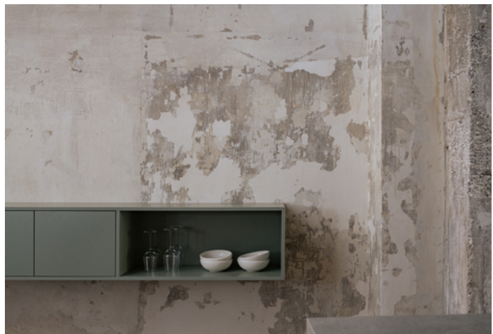
BWM rooms by wolfensson loft detail 01