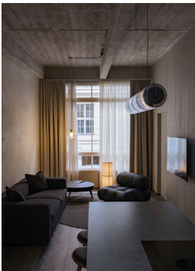
BWM rooms by wolfensson loft00