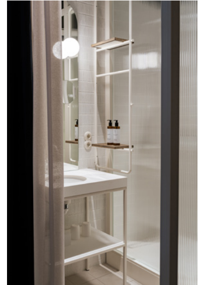
BWM rooms by wolfensson room bathroom01 ©BWM Designers & Architects / Ana Barros