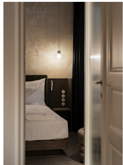
BWM rooms by wolfensson loft02 ©BWM Designers & Architects / Ana Barros