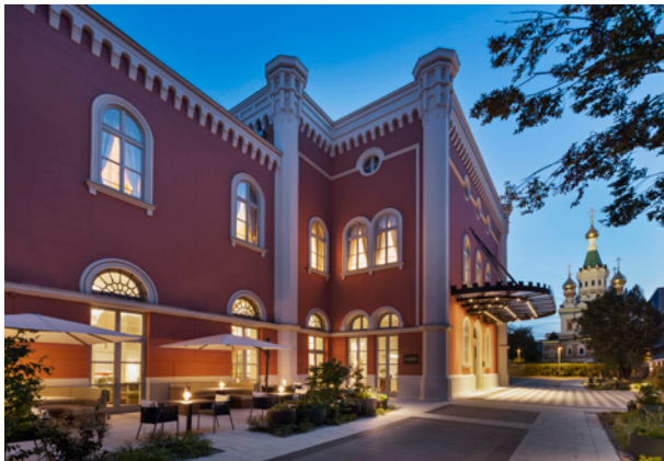
BWM Imperial Riding Scool / Exterior 06