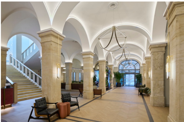
BWM Imperial Riding Scool/ Lobby 02 © BWM Designers & Architects / Lukas Schaller