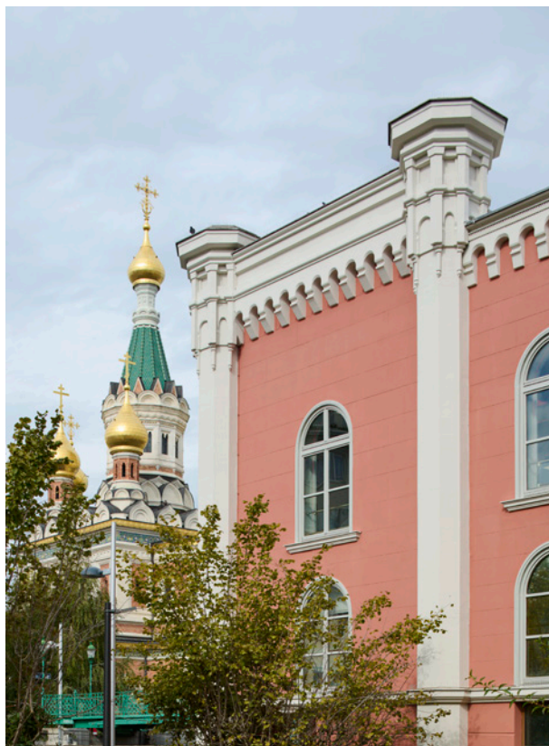
BWM Imperial Riding Scool/ facade church © BWM Designers & Architects / Lukas Schaller