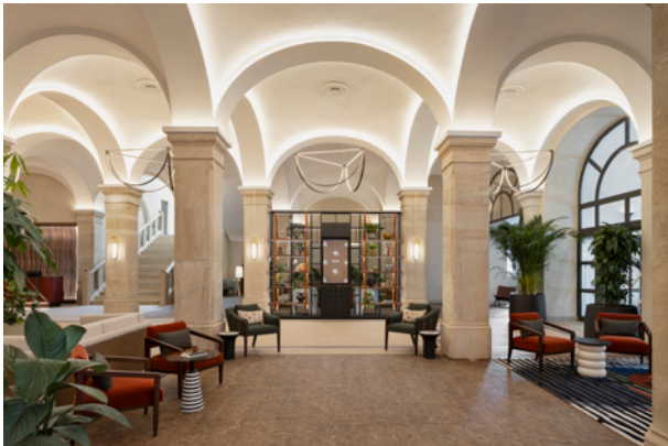
BWM Imperial Riding Scool/ Lobby 01