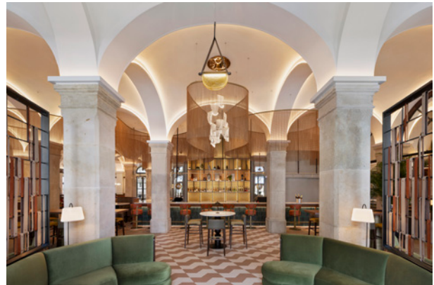
BWM Imperial Riding Scool/ Bar