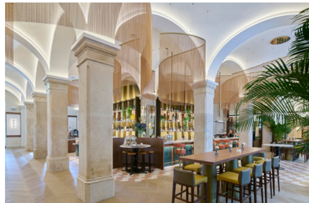
BWM Imperial Riding Scool/ Bar © BWM Designers & Architects / Lukas Schaller