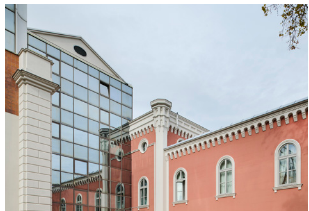
BWM Imperial Riding Scool / facade mirror © BWM Designers & Architects / Lukas Schaller