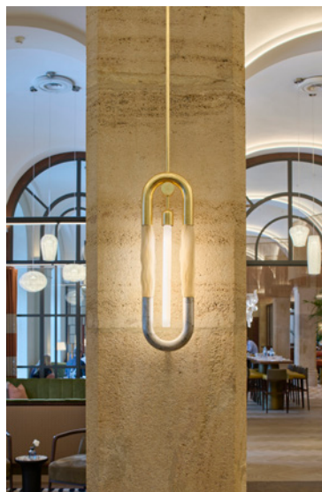
BWM Imperial Riding Scool/ Lobby Detail ©BWM Designers & Architects/Lukas Schaller