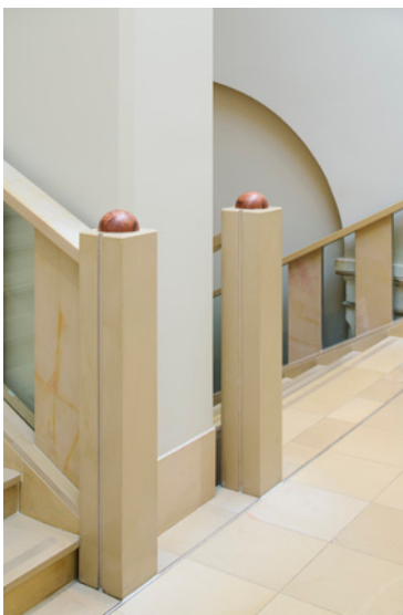
BWM Imperial Riding Scool/ Stairs Detail ©BWM Designers & Architects/Lukas Schaller