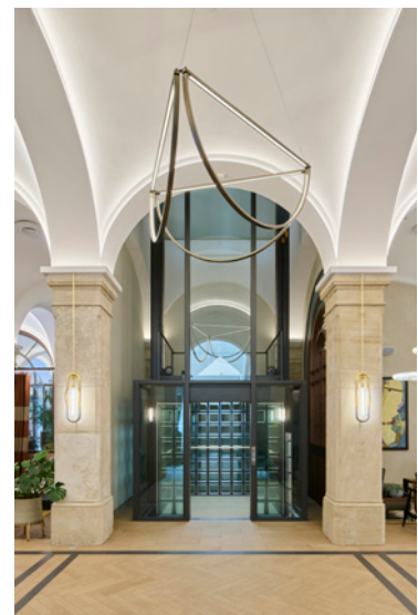
BWM Imperial Riding Scool/ Elevator ©BWM Designers & Architects/Lukas Schaller