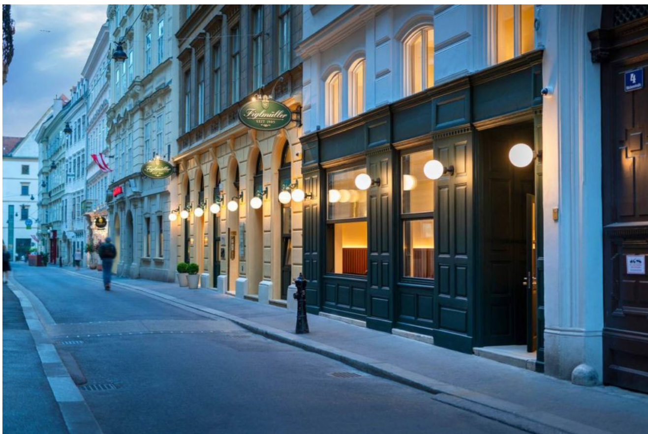
Beeld door BWM Architecten / Severin Wurnig