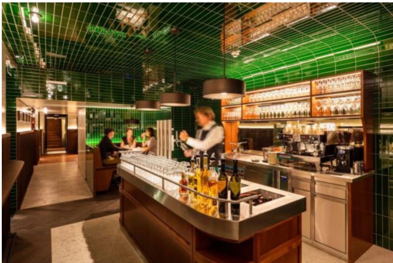
Figlmüller restaurant door BWM Architecten. Beeld door BWM Architecten / Severin Wurnig

BWM Architecten heeft het Figlmüller restaurant in Wenen gerenoveerd en uitgebreid met de begane grond van het aangrenzende gebouw.