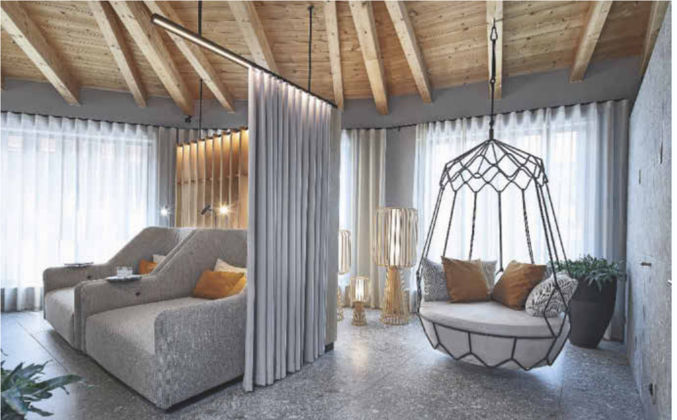
Im Hotel Entners am See entspannt der Gast auf einer Spa-Schaukel, die ergänzt wird von behaglichen Lounge-Sesseln.

„Individualisierung ist das Thema schlechthin. Dazu gehört, dass man aus einem Hotel einen verbindlichen Ort macht“