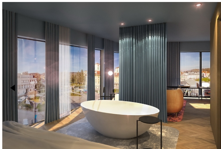
| Hotel Galántha in Eisenstadt (c) BMW Architekten

Das neue Hotel Galántha in Eisenstadt hat am 1. September sein Soft-Opening gefeiert. Die Lage am Beginn der Fußgängerzone im Schlossquartier mit dem Schloss Esterházy und den ehemaligen Stallungen ist ideal.