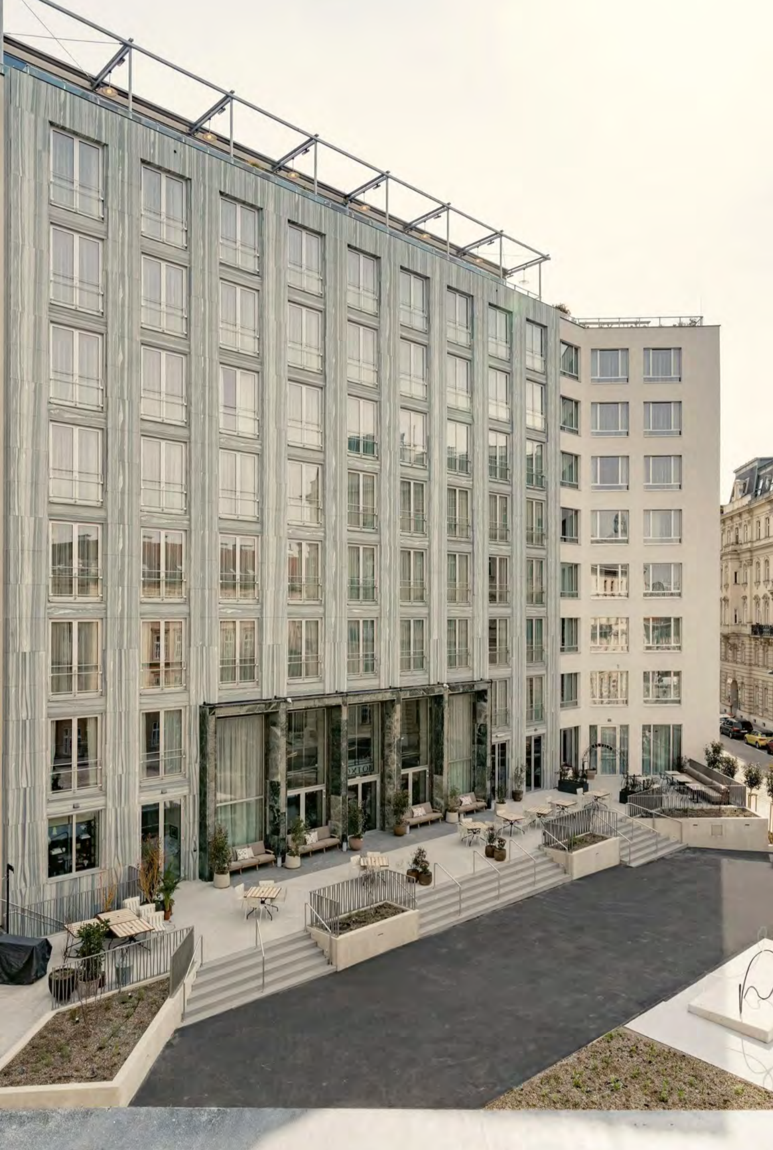
Das Hotel von außen. AnaBarro

In der Kategorie Hotel und Serviced Apartments konnte The Hoxton im 3. Bezirk die Wahl für sich entscheiden. Die Bewertung: „Das Hoxton ist ein herausragendes Beispiel dafür, wie sich ein denkmalgeschütztes Büroobjekt stilschön, stimmig und nachhaltig so umnutzen lässt, dass die ganze Stadt davon profitiert. Architekturbeispiele aus den 1950er Jahren sind selten und wurden lange Zeit nicht geschätzt. Seine Architektur respektiert das Original, setzt aber auch neue Akzente. Der prominent gelegene Vorplatz wurde aufgewertet und lädt zusammen mit dem Gastronomie-Angebot im Hotel die lokale Bevölkerung ein sich unter die internationalen Hotelgäste zu mischen.“