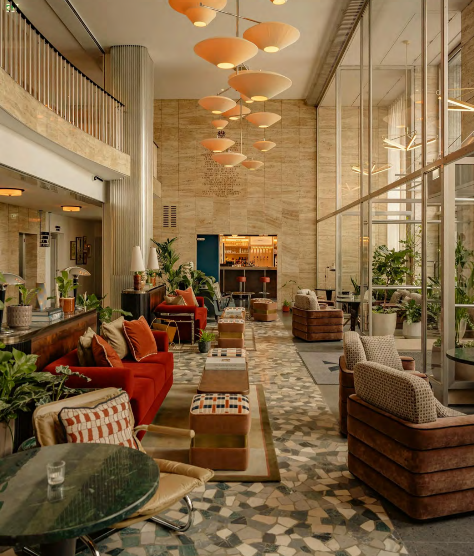
The Hoxton Innenansicht. BWM_DesignersArchitects_AnaBarros