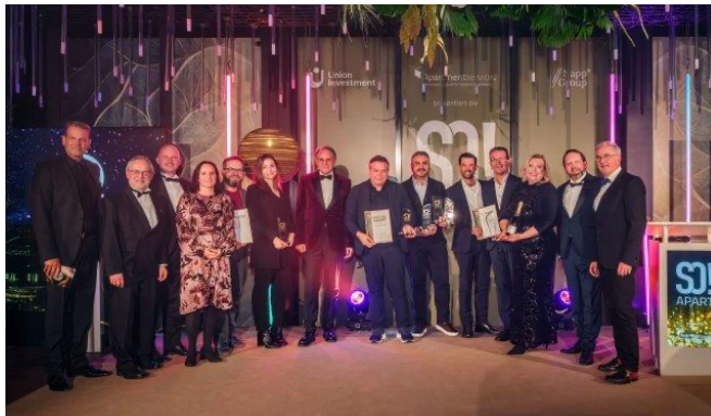
Gewinner SOAPART 2025.