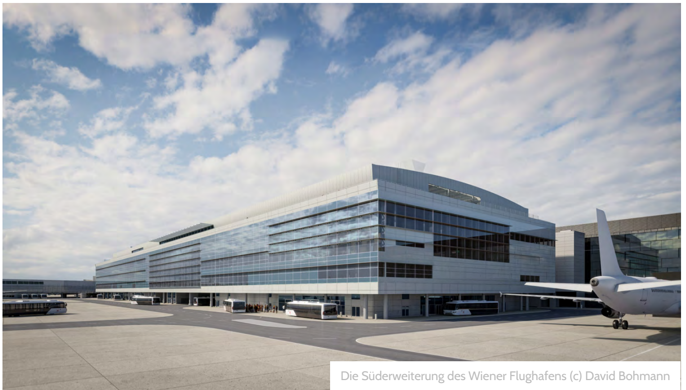
Die Süderweiterung des Wiener Flughafens

Die neue Terminal-3-Süderweiterung ist jedoch weit mehr als ein kulinarisches Projekt. Auf insgesamt rund 70.000 Quadratmetern entstehen neue Shopping- und Gastronomieflächen, großzügige Aufenthaltsbereiche, exklusive Lounges mit insgesamt 6.000 Quadratmetern, verbesserte Transerverbindungen sowie 18 neue Bus-Gates. Eine zentrale Sicherheitskontrolle auf modernstem Stand der Technik rundet das Gesamtkonzept ab. Mit diesem Ausbau macht der Flughafen Wien den entscheidenden Schritt von der bestehenden Skytrax-4-Star-Auszeichnung hin zur angestrebten 5-Sterne-Liga der internationalen Airports – und setzt dabei ganz bewusst auf den Geschmack Wiens.