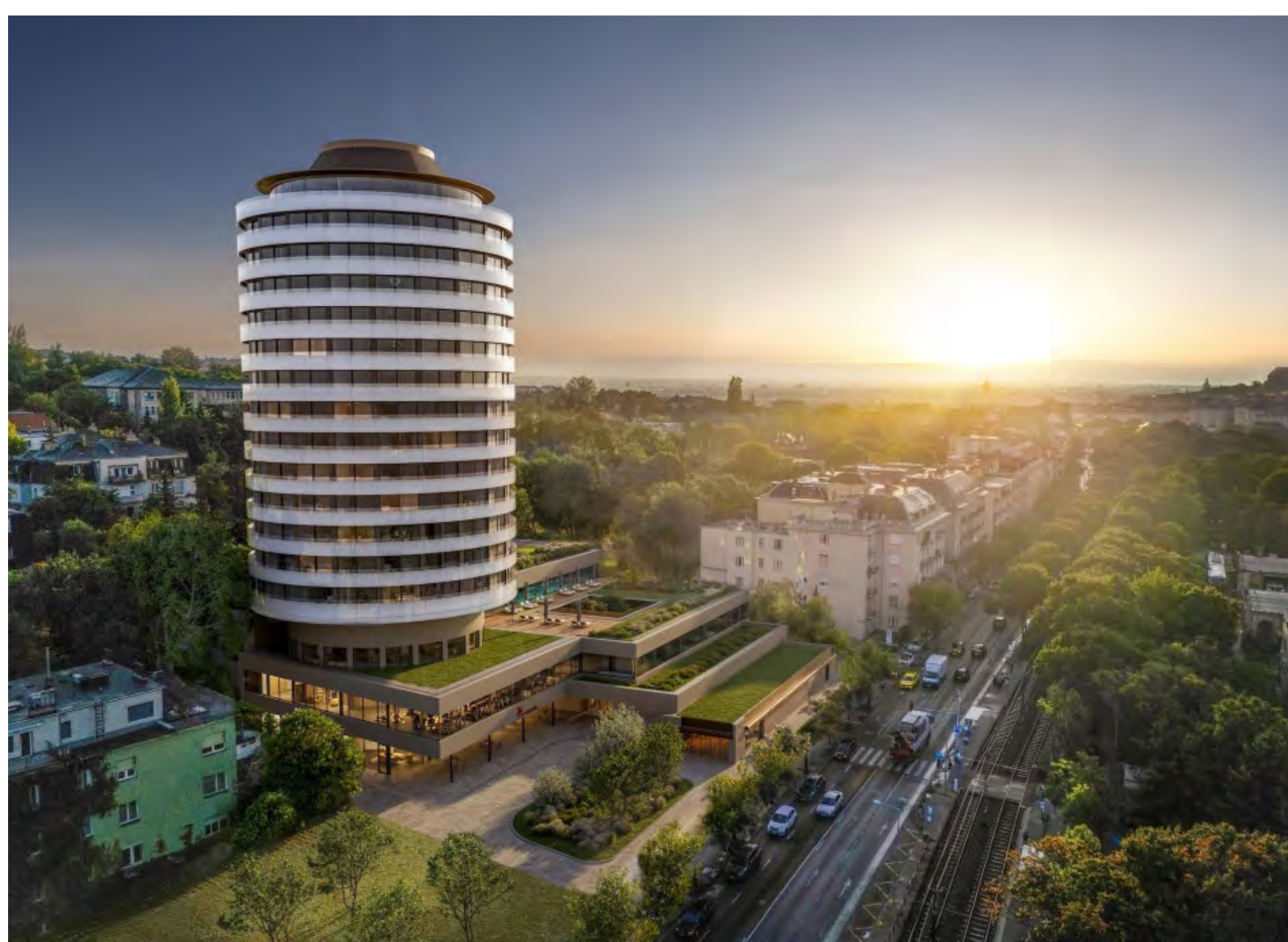
A csodálatos kilátás is jár a lakásokhoz a Körszállóban

A beruházás során elvégzett részletes feltárások és kiegészítő statikai vizsgálatok egyértelművé tették, hogy a hatvanéves tartószerkezet állapota már nem megfelelő. Az épület enyhén megdőlt, így megtartásával sem az állékonyság, sem a modern repedéstágassági követelmények nem lennének garantálhatók. Ennek eredményeképpen a torony alsó szintjeinek elbontása is elkerülhetetlenné vált, a munkálatok a módosított építési engedély alapján haladnak tovább. A teljes újjáépítés ugyanakkor lehetőséget ad arra, hogy az épület maradéktalanul megfeleljen a mai kor elvárásainak: az új szerkezettel megvalósul a teljes akadálymentesítés, a biztonságos, kétirányú menekítés, valamint a tűzoltó felvonók beépítése is.