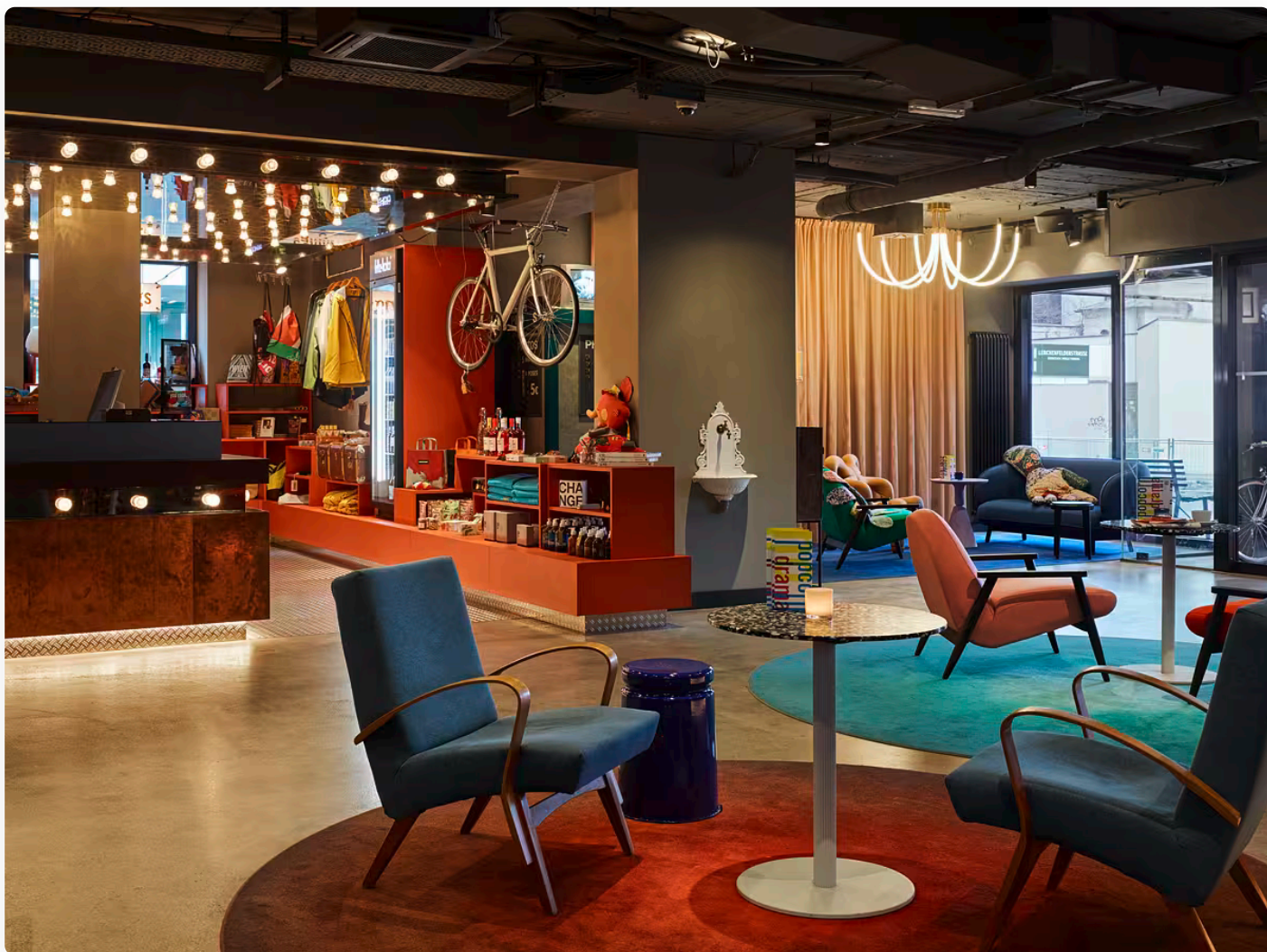
25hours Hotel Wien