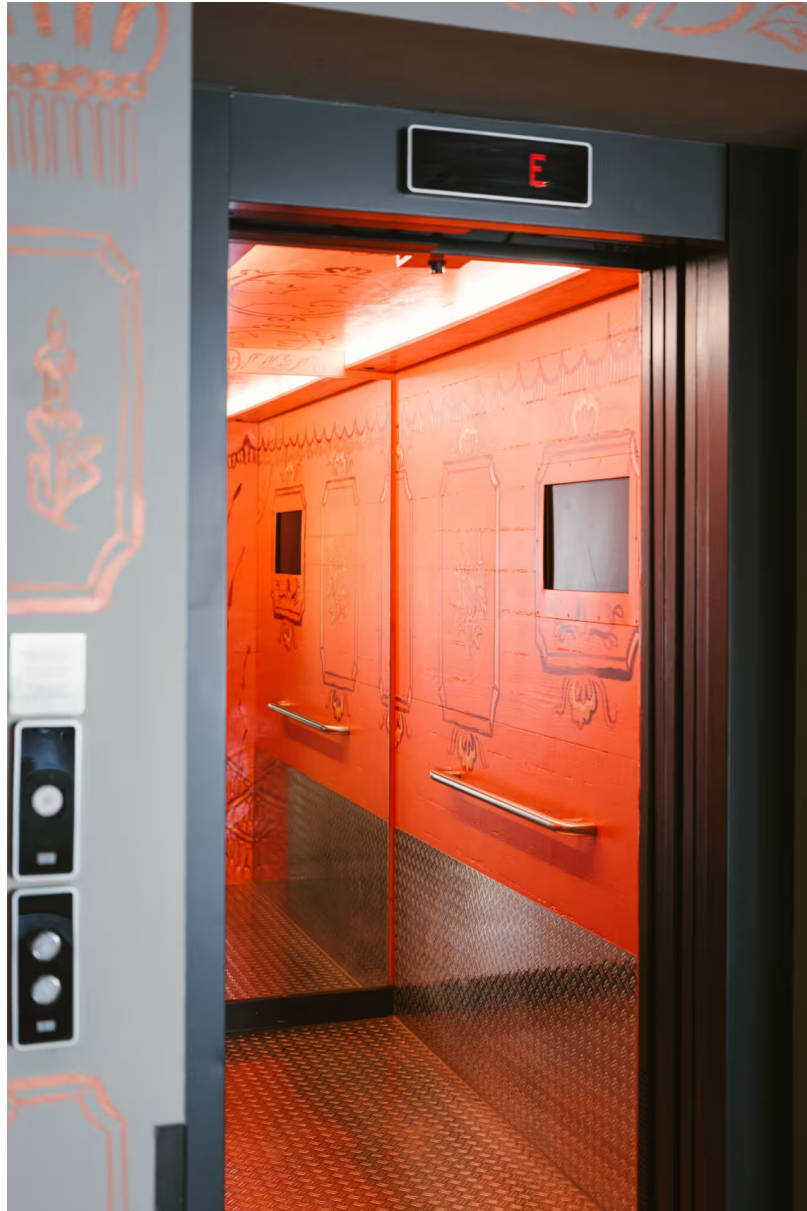
25hours Hotel Wien